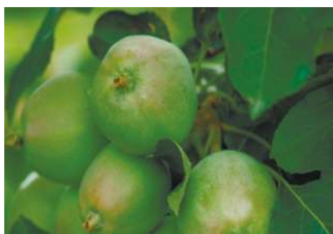
Делан® Фло, 0,5 л/га