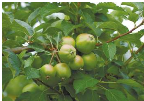
Делан® Фло (0,7 л/га) + Серкадис® (0,25 л/га)