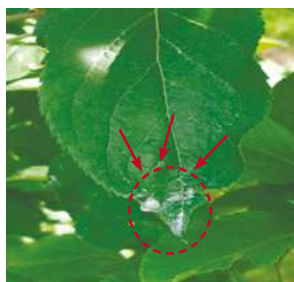
д.в. каптан (800 г/кг), 1,8 кг/га