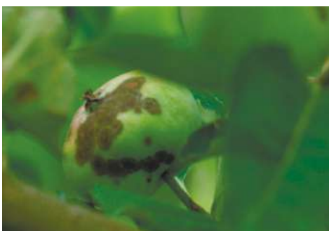
Контроль (без обработки)

современная удобная препаративная форма и отличная дождеустойчивость