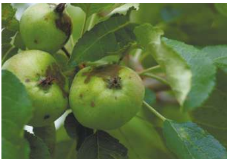
Контроль (без обработки)