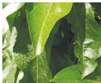
Делан® Фло, 0,5 л/га